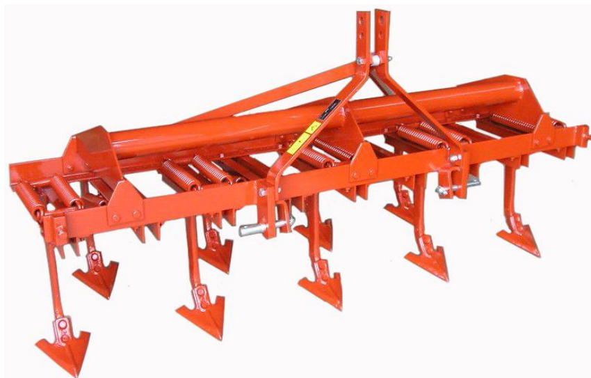
Tiller a molle serie media CMR-9 Cultivateur avec dents à ressort CMR-9 Cultivator with spring tines CMR-9