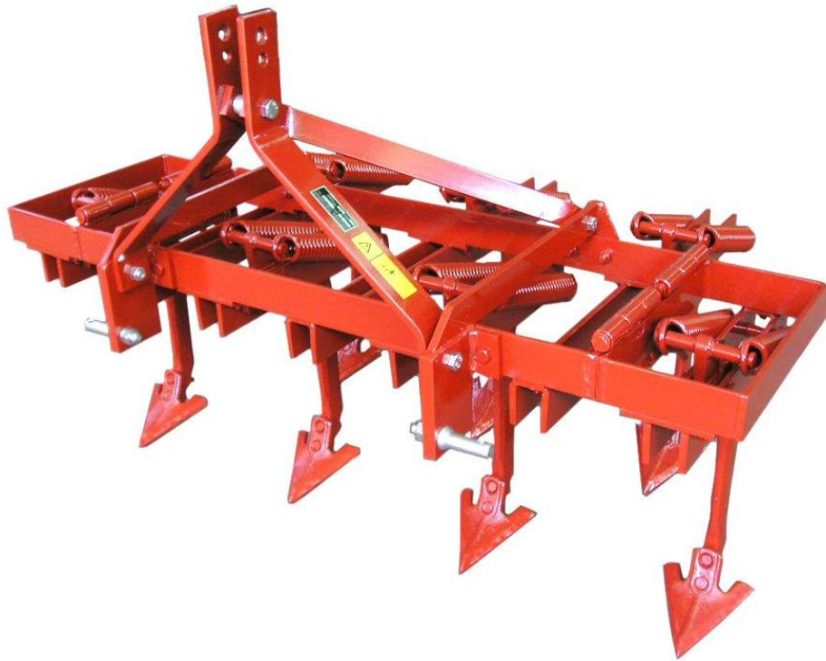
Tiller a molle serie pesante CMP-7 (5+2) Cultivateur avec dents à ressort CMP-7 Cultivators with spring tines CMP-7