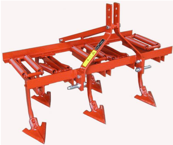
Tiller a molle serie leggera ETM-30 Cultivateur avec dents à ressort ETM-30 Cultivator with spring tines ETM-30

Coltivatori - Tiller a molle per trattori da 24 a 140 CV. Cultivateur pour tracteur 24-140 CV / Cultivators for tractor 24-140 HP