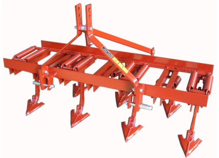
Tiller a molle serie media CM-7 Cultivateur avec dents à ressort CM-7 Cultivator with spring tines CM-7