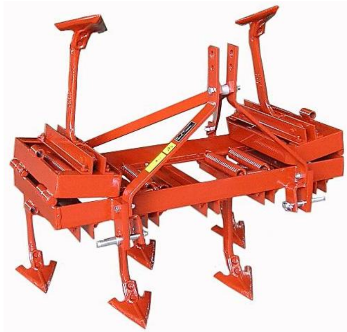
Tiller a molle CM-7 (5+2 ancore ripieghevoli) Cultivateur CM-7 (5+2 dents rabattables) Cultivator CM-7 (5+2 folding tines)